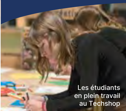
Les étudiants en plein travail au Techshop