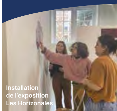
Installation de l'exposition Les Horizontales