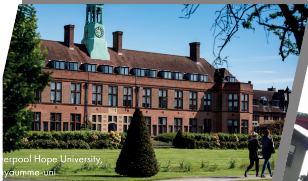
Liverpool Hope University, liverpool.hope.ac.uk