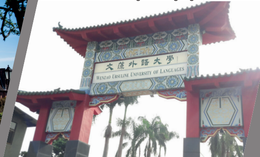
Wenzao Ursuline College of Languages, Taiwan